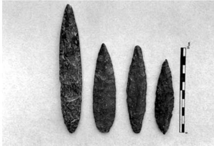
Figura 2. Puntas foliáceas (sector izquierdo) y doble puntas (sector derecho), Piedra Azul.

Hojas largas. Presentan el extremo distal desviado, y están trabajadas en ambas caras y en todo el borde o bisel. Piezas de sección alta, cuya función podría corresponder a desangradores. La tecnología de manufacura es similar a la del sitio Lancha Packewaia. Elaboradas en basalto porfírico, andesita basáltica y cuarcita verdosa, con tamaño promedio de 120 mm ( Figura 3 ).