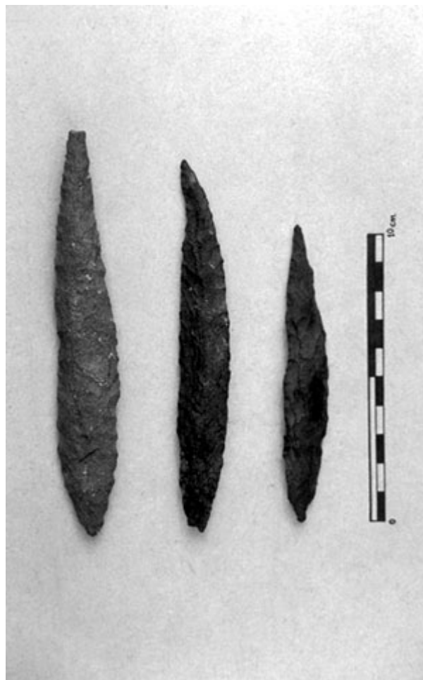
Figura 3. Hojas largas, Piedra Azul.

Hojas largas. Presentan el extremo distal desviado, y están trabajadas en ambas caras y en todo el borde o bisel. Piezas de sección alta, cuya función podría corresponder a desangradores. La tecnología de manufacura es similar a la del sitio Lancha Packewaia. Elaboradas en basalto porfírico, andesita basáltica y cuarcita verdosa, con tamaño promedio de 120 mm ( Figura 3 ).