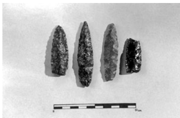
Figura 4. Puntas lanceoladas, Piedra Azul.

Hojas lanceoladas. Se trata de piezas lanceoladas o sublanceoladas tipo "hoja de laurel", de sección alta, que presentan trabajo de tallado en ambas caras por percusión, con los bordes retocados completamente por presión, de morfología escamosa. Elaboradas en obsidiana y riolita, con medidas entre 71 y 83 mm ( Figura 4 ).