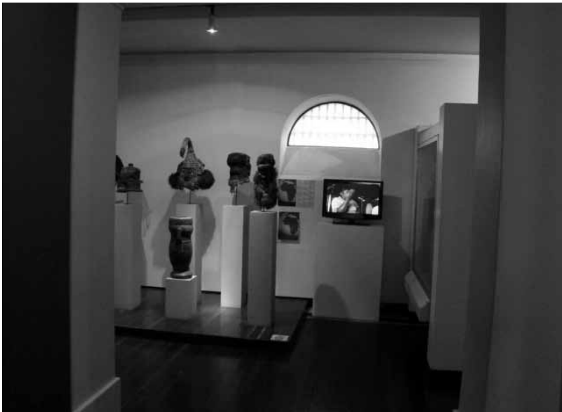
Figura 3. Museo Nacional de Colombia, segundo piso. Televisor con imágenes de afrodescendientes. National Museum of Colombia, second floor. TV images of afrocolombian people.

Evidentemente desde hace algunos años, los visitantes al Museo han encontrado no sólo exposiciones itinerantes internacionales, como esculturas chinas, egipcias e incaicas, sino también representaciones donde hay interacción entre el visitante y el Museo. Como lo sugiere Beatriz González, para fortuna de ella, esas intervenciones no han afectado la estructura narrativa básica (Junca 2011a); no sobra llamar la atención de que esas formas de representación fueron heredadas de la cultura histórica del héroe español (Colmenares 1987). De allí que el Museo Nacional le dé tanta importancia a objetos de próceres como Simón Bolívar o Francisco de Paula Santander. Bajo esa figura retórica, los indígenas son seres anónimos y los criollos personalidades determinadas.