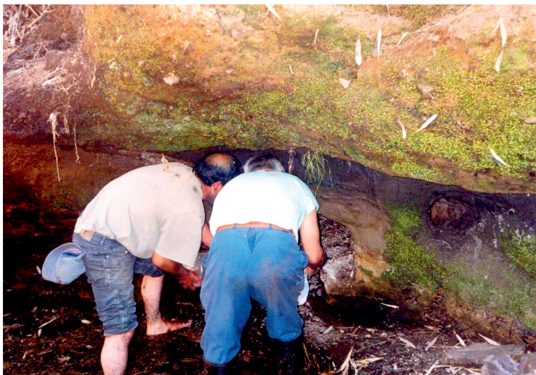
Figura 1. Renü (cueva) donde habita Juanico, espíritu tutelar de la Comunidad de Nolgehue. Renü (cave) where Juanico, the tutelary spirit of the Nolgehue community, dwells.

En la cuenca del río Bueno, los que participan en ellas se denominan a sí mismos kamaskos . En la actualidad constituyen un grupo minoritario dentro de sus comunidades, compuesto por los mayores o cabezas de no más de veinte grupos familiares en Pitruico (donde veneran al Abuelo Wenteyao), nueve familias en Nolgehue (morada de Juanico) y ocho en Maihue Carimallín (donde se rinde culto a Kintuante). Ellos son los encargados de mantener, resguardar y solventar las prácticas religiosas tradicionales, en un contexto que no se muestra favorable, porque se encuentra expuesto a profundos procesos de aculturación, que incluye la pérdida del manejo de la propia lengua. Para llevar adelante su tarea disponen de una organización basada en cargos, dirigida por un maestro de ceremonias, una kamaska mayor, un capitán, sargentos y bastoneros, cuya autoridad se activa solo en el período de desempeños rituales, que en esta área suele tener una periodicidad anual.