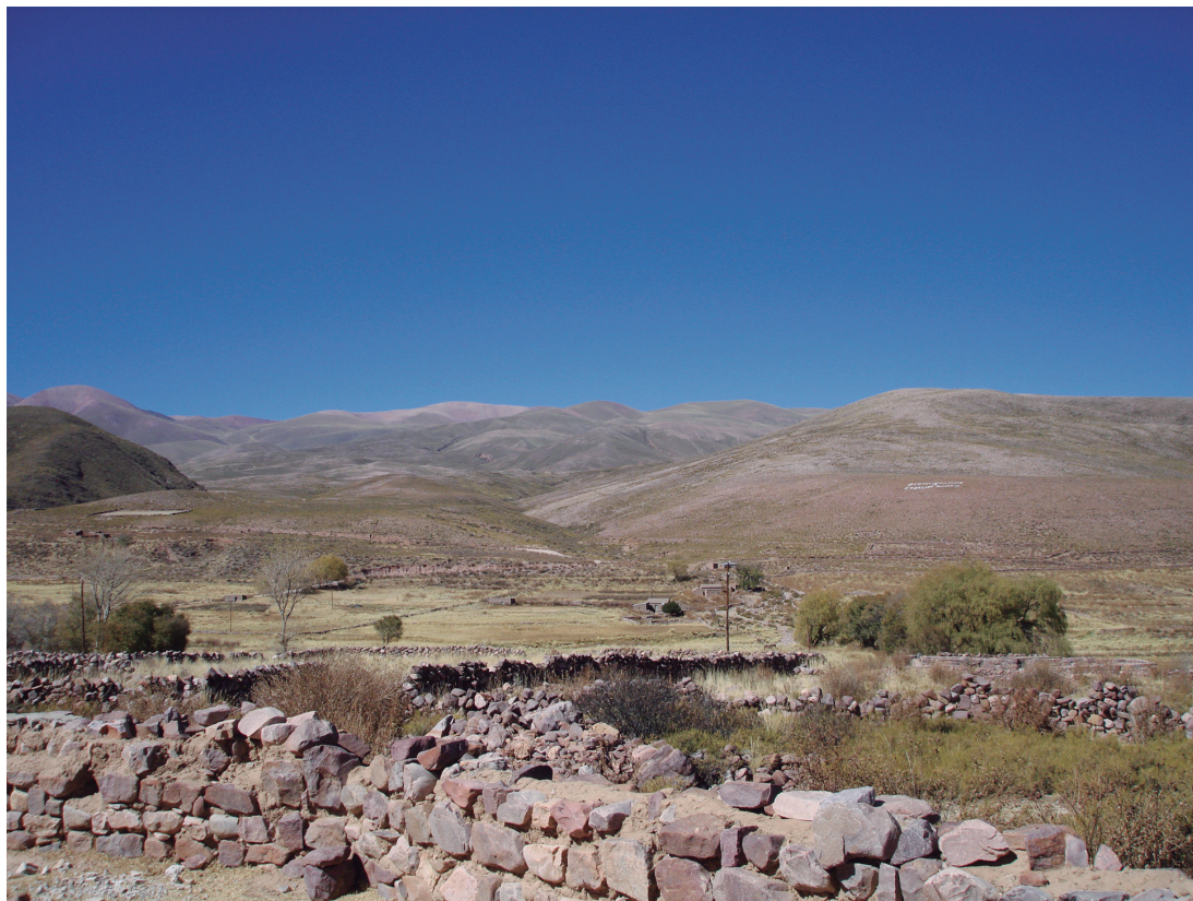
Figura 3. Chaupi Rodeo.

En esta comunidad se practica una agricultura a pequeña escala destinada al autoconsumo, la venta en el mercado local o eventualmente trueques en las