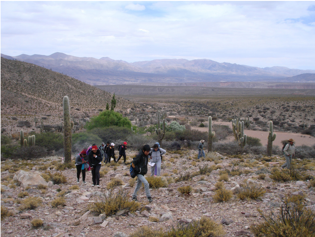
Figura 4. De regreso a Humahuaca desde Capla.

Returning to Humahuaca from Capla.