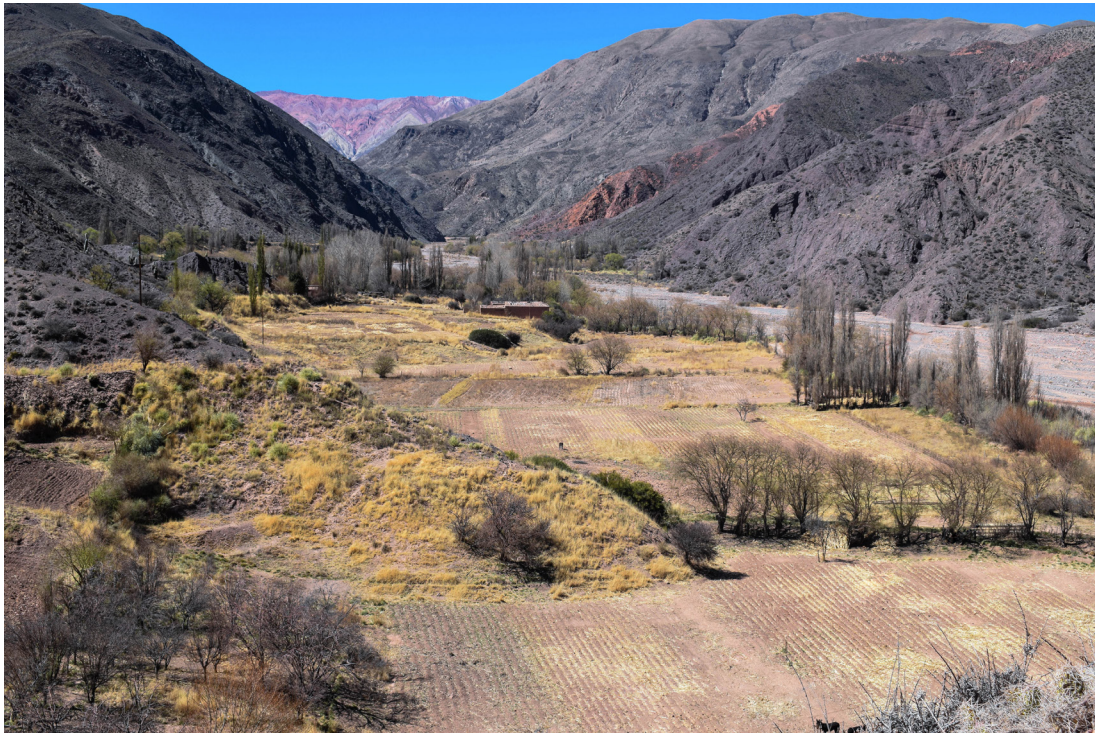
Figura 2. Ocumazo en agosto.