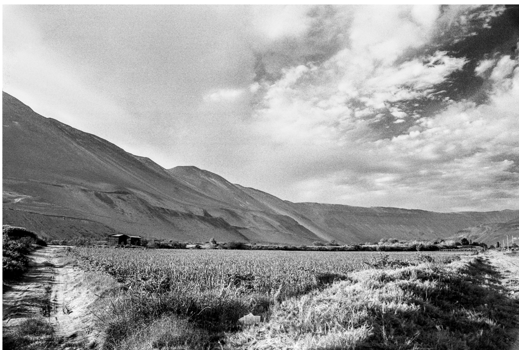
Figura 5. La vegetación y las cuevas desérticas de Lluta. Arica, septiembre 2019. Registro: Claudio Casparrino.

The vegetation and desert slopes of Lluta. Arica, September 2019. Photographer: Claudio Casparrino.