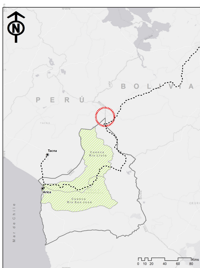
Figura 2. Valles de Azapa y Lluta (Arica, Chile).

Valleys of Azapa and Lluta (Arica, Chile).