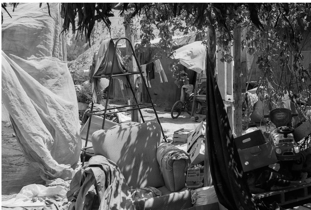
Figura 7. Residencia de agricultores aymaras bolivianos, al lado de invernadero de tomates en Azapa. Arica, septiembre 2019.

Residence of Bolivian Aymara farmers, beside the tomato greenhouse in Azapa. Arica, September 2019.