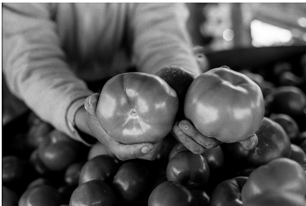
Figura 17. Agricultora muestra tomates producidos por su familia. Arica, septiembre 2019.

Farmer shows the tomatoes produced by her family. Arica, September 2019.