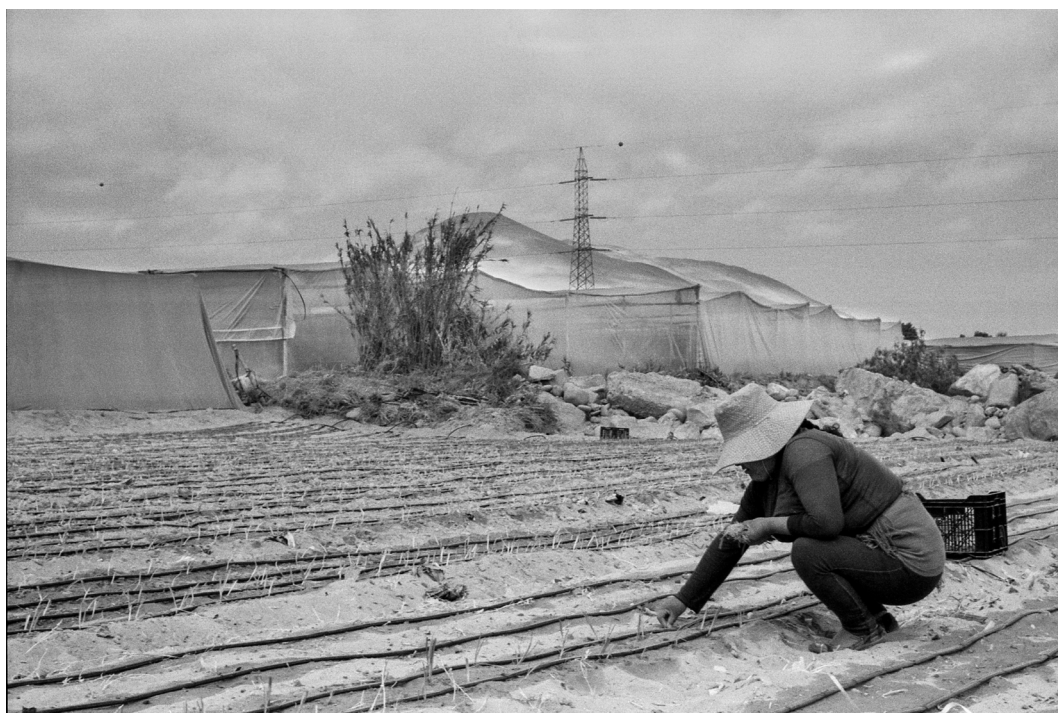
Figura 10. Agricultora aymara por jornal en Azapa. Arica, septiembre 2019.

Aymara man working for daily wages in Azapa. Arica, September 2019.