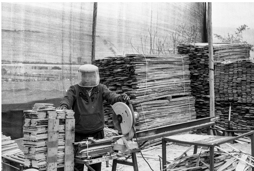
Figura 11. Aymara boliviano produciendo “toritos”, Azapa. Arica, septiembre 2019. Bolivian Aymara producing toritos in Azapa. Arica, September 2019.

Dada la posibilidad de solicitar el permiso de residencia que los/as bolivianos/as alcanzaron a través del acuerdo del Mercosur, la forma como estos/as migrantes se relacionan con el entorno cambió. Antes, tenían miedo de llevar a los/as hijos/as a la escuela, de mostrarse, de acudir a los servicios públicos de salud. Se escondían. Como muchos ya tienen papeles, se desenvuelven con mayor tranquilidad e interactúan más con el entorno socio-institucional. La posibilidad de dialogar con las autoridades locales sin miedo a la deportación terminó sincerando la compleja situación de las mujeres aymaras bolivianas en Azapa, como ellas mismas nos contaron. Estas pasaron a acudir a