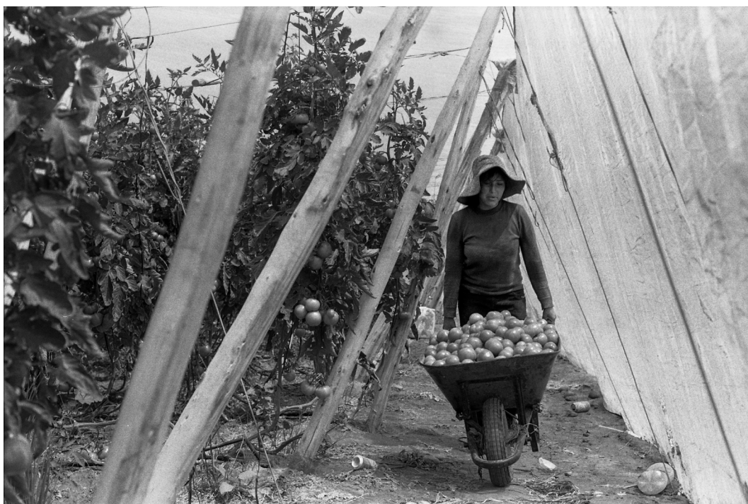
Figura 15. Agricultora aymara boliviana transporta tomates. Arica, septiembre 2019. Bolivian Aymara farmer transports tomatoes in Azapa. Arica, September 2019.