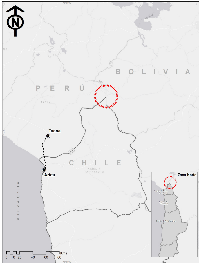
Figura 1. La Triple-frontera Andina.

The Andean Tri-border.