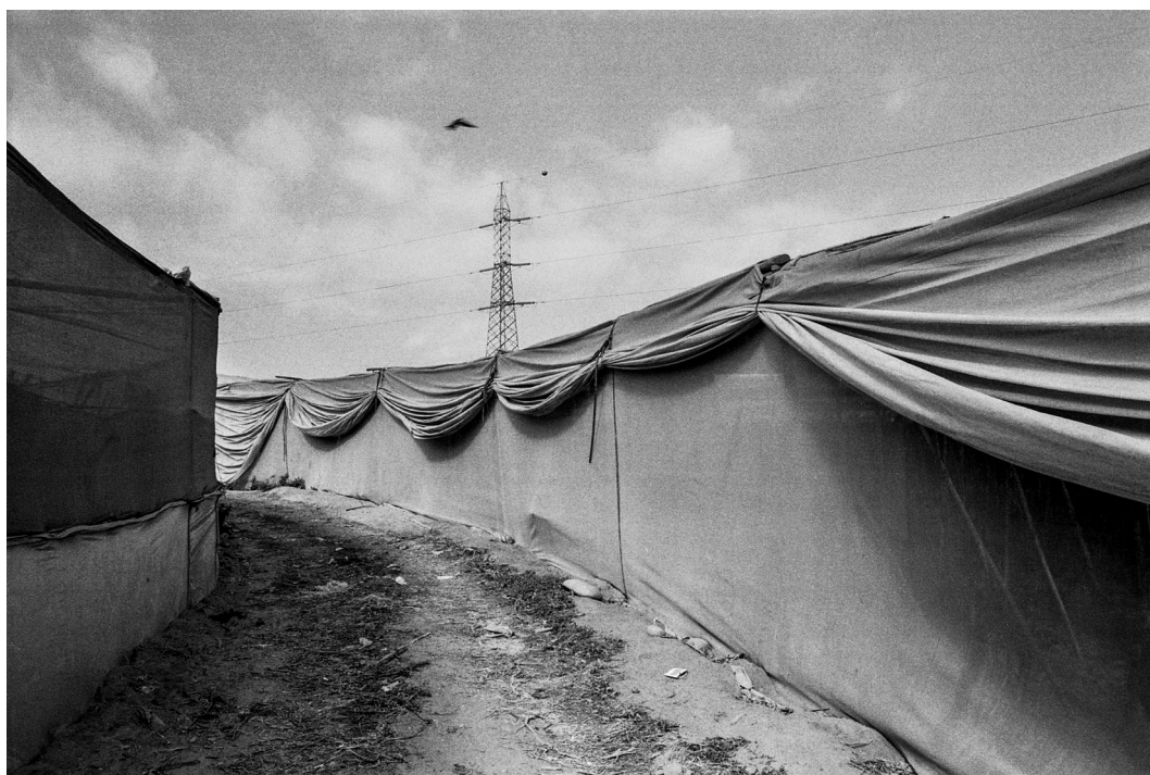
Figura 13. Invernaderos de tomates en Azapa. Arica, septiembre 2019.

Tomato greenhouses in Azapa. Arica, September 2019.