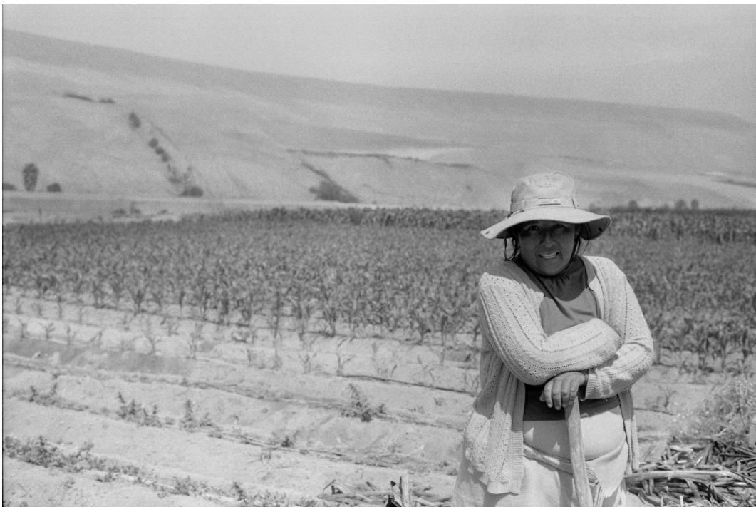
Figura 12. Agricultora aymara boliviana en Azapa. Arica, septiembre 2019.

Sí, había violencia intrafamiliar, mi papá y mi mamá [...]. Mi papá es machista, es machista. Él le golpeaba [...]. Mi pareja era así también. Para mí era un infierno y yo decidí: “voy a separarme”. Porque la gente dice que no tienes que separarte. Y a