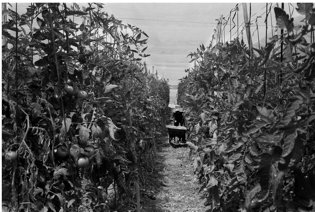
Figura 14. Agricultora aymara boliviana cosecha tomates. Arica, septiembre 2019.

Tomato greenhouses in Azapa. Arica, September 2019.