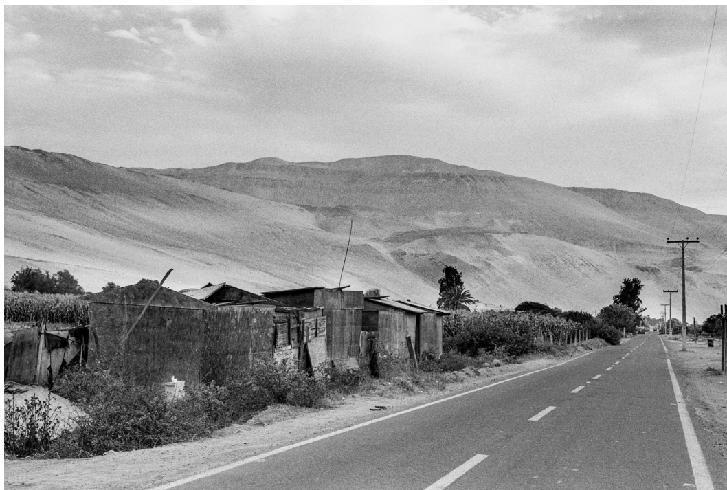
Figura 3. La carretera y los primeros árboles del valle. Arica, septiembre 2019.

The road and the first trees of the Azapa Valley. Arica, September 2019.