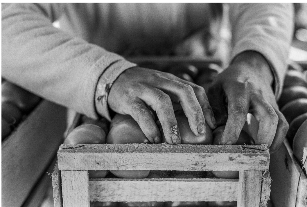
Figura 16. Agricultora acomoda los tomates en la caja. Arica, septiembre 2019. Farmer arranges tomatoes in a box for marketing. Arica, September 2019.