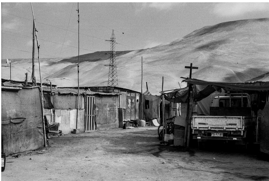
Figura 8. Residencias de agricultores aymaras bolivianos en Azapa. Arica, septiembre 2019.

Residence of Bolivian Aymara farmers, beside the tomato greenhouse in Azapa. Arica, September 2019.