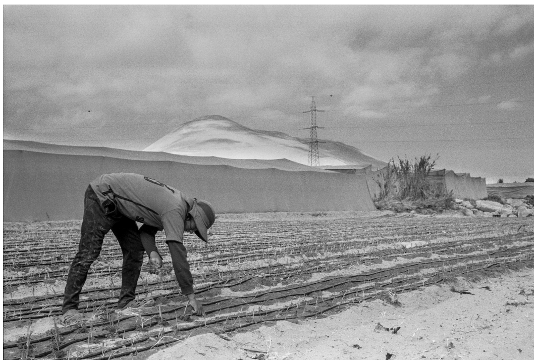
Figura 9. Agricultor aymara por jornal en Azapa. Arica, septiembre 2019.

Aymara man working for daily wages in Azapa. Arica, September 2019.