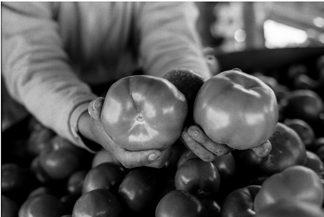
Figura 17. Agricultora muestra tomates producidos por su familia. Arica, septiembre 2019. Registro: Claudio Casparrino.

Farmer shows the tomatoes produced by her family. Arica, September 2019. Photographer: Claudio Casparrino.