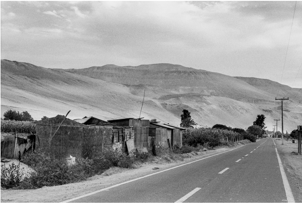
Figura 3. La carretera y los primeros árboles del valle. Arica, septiembre 2019.

The road and the first trees of the Azapa Valley. Arica, September 2019.