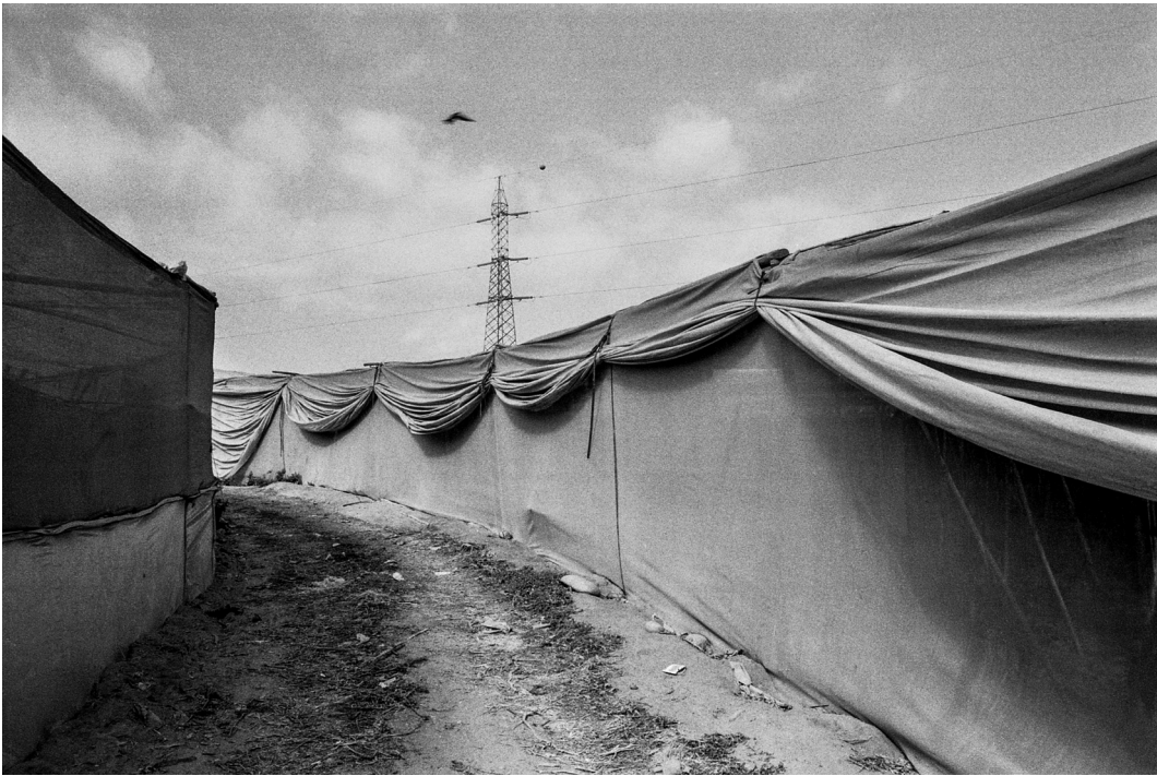
Figura 13. Invernaderos de tomates en Azapa. Arica, septiembre 2019.

Tomato greenhouses in Azapa. Arica, September 2019.