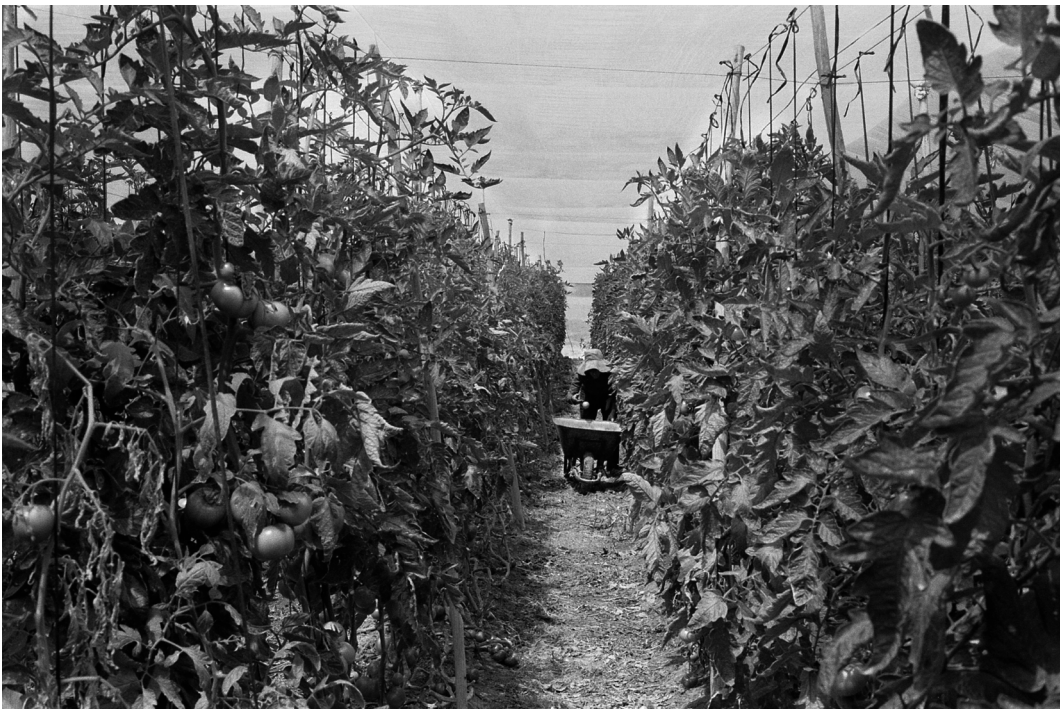
Figura 14. Agricultora aymara boliviana cosecha tomates. Arica, septiembre 2019.

Tomato greenhouses in Azapa. Arica, September 2019.