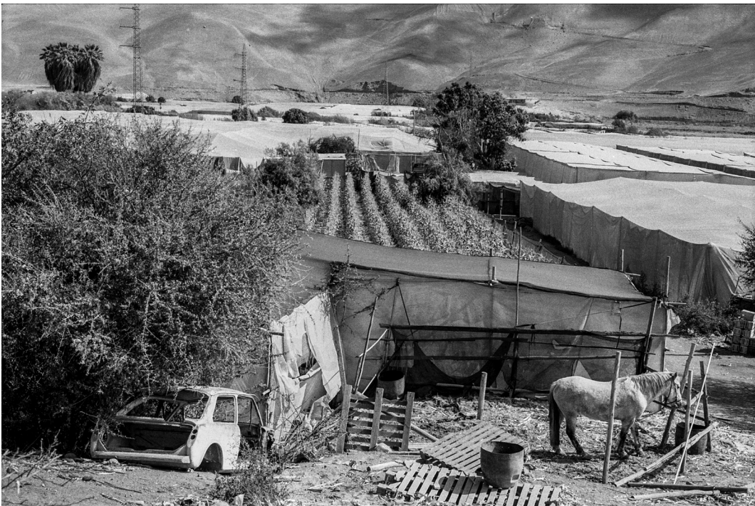
Figura 4. Plantaciones de choclo junto de los invernaderos de tomates en Azapa. Arica, septiembre 2019.

The road and the first trees of the Azapa Valley. Arica, September 2019.